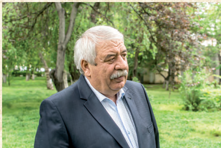
Магомед Ахмедов, народный поэт Дагестана