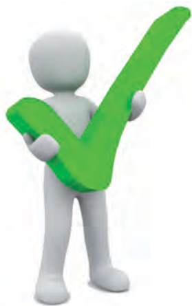
Белые 71,8 млн