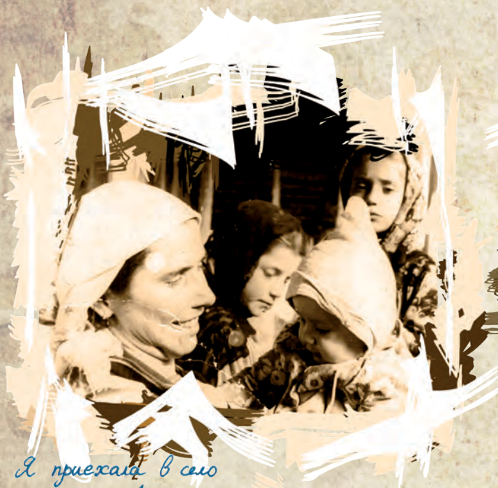
Я приехала в село мама с двоюродной сестрой и рядом моя будущая золовка 1967 год

ми жизненными ситуациями. Это всё обогащение и выкладывается сегодня на эти листочки с моим рассказом об обыкновенной дагестанской девочке.