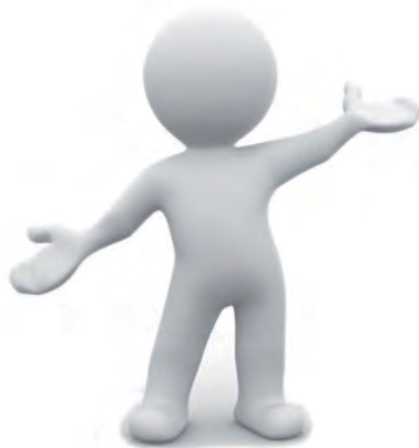
Серые ≈28 млн