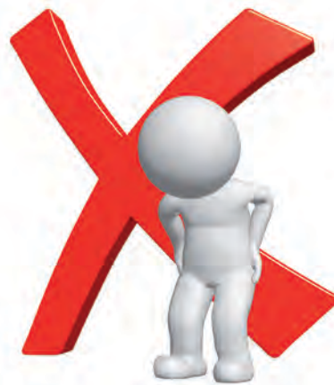
Грустные 3,9 млн+

человек — вдвое больше цифры, озвученной Голиковой. К слову, за прошедший год ситуация эта изменилась в худшую сторону — в «тень» ушли 5 млн работающих пенсионеров, которым перестали индексировать пенсии.