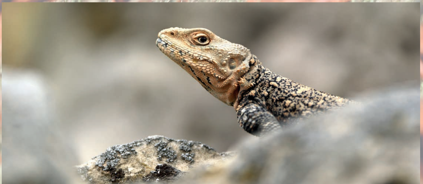
(Самурский лес, Сары-Кум, Сулакский каньон, Гамсутль)

Вот и Дагестан — одно из мест, которые остаются в памяти. Очень надеюсь, что ещё вернусь к вам.